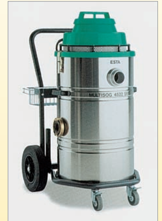
MULTISOG Φορητή σκούπα για αναρρόφηση ξηρής σκόνης και υγρών