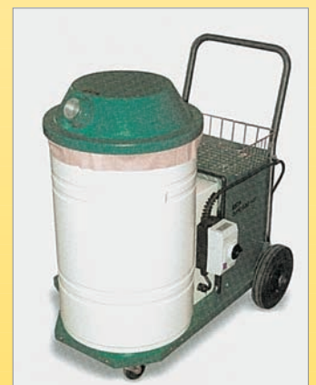
DUROSOG Φορητή σκούπα για καθαρι- σμό μηχανών, κατάλληλη ακόμη και για δύσκολες εφαρμογές (σκόνες με υγρασία και λάδια) λόγω του συστήματος διπλών προφίλτρων που προστα- τεύουν το τελικό φίλτρο