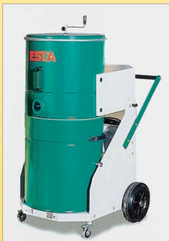
EUROSOG Φορητή σκούπα γενικής χρήσης με 3 αντλίες αναρρόφησης για καθα- ρισμό χώρων αλλά και για συνεχή λειτουργία σε τοπικές αποκονιώσεις