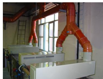
ΑΠΑΓΩΓΗ ΟΞΕΩΝ ΕΠΙΜΕΤΑΛΛΩΣΗΣ ΣΤΗΝ ΠΥΡΚΑΛ Α.Ε.