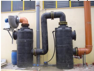
ΠΛΥΝΤΗΡΙΔΑ ΑΕΡΙΩΝ ΟΞΕΩΝ ΣΤΗΝ ΜΠΑΛΗΣ ΧΗΜΙΚΑ Α.Ε.

9. Ειδικές εγκαταστάσεις εξαερισμού με απόσπηση και έκπλυση ατμαερίων