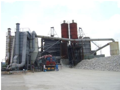
ΑΣΒΕΣΤΟΠΟΙΙΑ ΒΕΛΕΣΤΙΝΟΥ Α.Ε. ΑΠΟΚΟΝΙΩΣΗ 2 ΥΨΙΚΑΜΙΝΩΝ

Στις εγκαταστάσεις αυτές έχουμε προσφέρει ολοκληρωμένες λύσεις διαχείρισης της σκόνης με διατάξεις ελέγχου θερμοκρασίας, λειτουργία BY-PASS, συνεχή μέτρηση συγκέντρωσης σωματιδίων στην καμινάδα κ.λ.π.