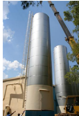
ΑΝΟΞΕΙΔΩΤΑ ΣΙΛΟ ΣΤΗΝ TUPPERWARE HELLAS

8. Εγκαταστάσεις κεντρικής "σκούπας", σε διάφορες εφαρμογές και υλικά όπως είναι σκόνη ασβέστη, καλαμίνα κ.λ.π.