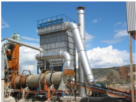
ΑΣΦΑΛΤΙΚΟ ΣΥΓΚΡΟΤΗΜΑ ΣΤΗΝ ΙΝΤΕΡΜΠΕΤΟΝ Α.Ε.

Αντίστοιχες εγκαταστάσεις έχουμε κατασκευάσει για την ΙΝΤΕΡΜΠΕΤΟΝ Α.Ε., ΠΡΑΞΙΣ ΤΕΧΝΙΚΗ Α.Ε., ΦΙΝΟΜΠΕΤΟΝ Α.Ε.