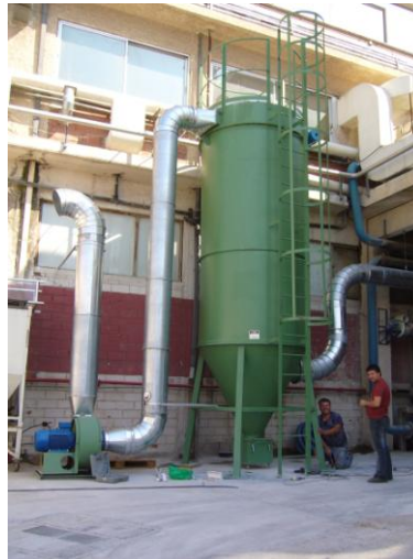
ΑΠΟΚΟΝΙΩΣΗ ΑΝΑΜΙΚΤΗΡΙΩΝ ΚΑΙ ΠΑΡΑΓΩΓΗΣ ΣΤΗΝ VETERIN Α.Ε.

Η αποκονίωση στις εγκαταστάσεις αυτές, λόγω των προϊόντων που χειριζόμαστε, είναι ειδικών απαιτήσεων με υψηλό βαθμό συγκράτησης με πιστοποιητικό ΒΙΑ και κατά περίπτωση με συνδυασμό σακοφίλτρων με απόλυτα φίλτρα.