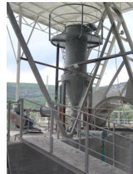
ΚΕΝΤΡΙΚΗ ΣΚΟΥΠΑ ΓΙΑ ΑΣΒΕΣΤΗ

9. Ειδικές εγκαταστάσεις εξαερισμού με απόσπηση και έκπλυση ατμαερίων