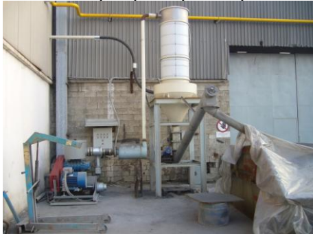
ΚΕΝΤΡΙΚΗ ΣΚΟΥΠΑ ΓΙΑ ΚΑΛΑΜΙΝΑ ΣΤΗΝ Ο-ΕRLIKON Α.Ε.

8. Εγκαταστάσεις κεντρικής "σκούπας", σε διάφορες εφαρμογές και υλικά όπως είναι σκόνη ασβέστη, καλαμίνα κ.λ.π.