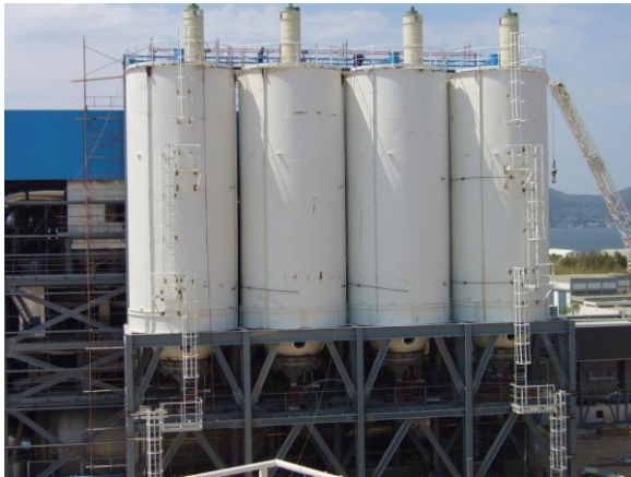
ΣΙΛΟ ΞΗΡΑΜΕΝΗΣ ΥΛΙΟΣ ΣΤΗΝ ΨΥΤΤΑΛΕΙΑ

Επίσης προμηθεύουμε βιομηχανικό εξοπλισμό όπως κοχλίες μεταφοράς υλικών, βιομηχανικές ζυγίσεις κ.λ.π.