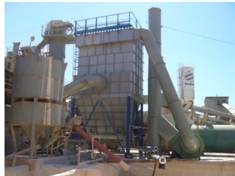
ΑΣΦΑΛΤΙΚΟ ΣΥΓΚΡΟΤΗΜΑ ΠΡΑΞΙΣ ΤΕΧΝΙΚΗ Α.Ε.