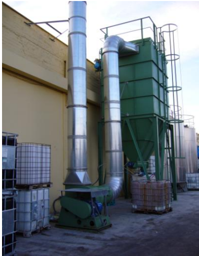
ΑΠΟΚΟΝΙΩΣΗ ΣΥΣΚΕΥΑΣΙΑΣ ΣΤΗΝ ΑΛΑΠΙΣ Α.Ε.