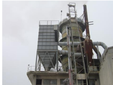
ΑΣΒΕΣΤΟΠΟΙΙΑ ΤΣΑΡΟΥΧΑΣ Ο.Ε.