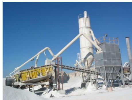
ΑΠΟΚΟΝΙΩΣΗ ΛΑΤΟΜΕΙΟΥ ΣΤΗΝ ΙΝΤΕΡΜΠΕΤΟΝ Α.Ε.

Οι εγκαταστάσεις μας περιλαμβάνουν μία εκτεταμένη λίστα εφαρμογών που αναφέρεται σε εργοστάσια τσιμέντου και παρεμφερών προϊόντων με πελάτες εταιρείες όπως ΤΣΙΜΕΝΤΑ ΤΙΤΑΝ, Α.Ε., Α.Γ.Ε.Τ. ΗΡΑΚΛΗΣ Α.Ε., ΖΛΑΤΝΑ